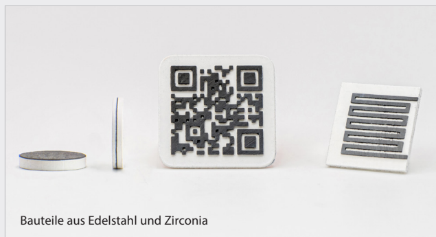
Bauteile aus Edelstahl und Zirconia

Das offene Werkstoffsystem erleichtert die Entwicklung maßgeschneiderter Werkstoffe und deren Kombinationen. Kunden können Parameter mithilfe der offenen Softwaretechnologie gezielt optimieren.