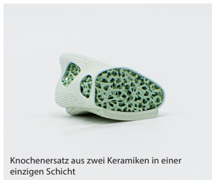
Knochenersatz aus zwei Keramiken in einer einzigen Schicht